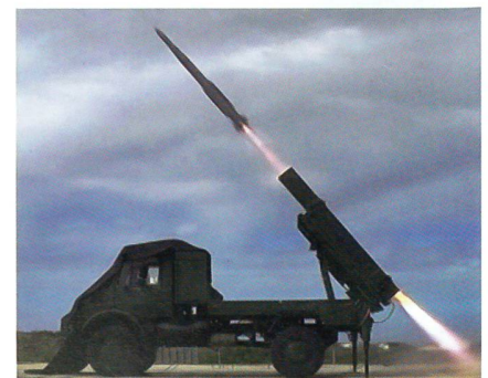
Der Boden-Luft-Lenkflugkörper IRIS-T.