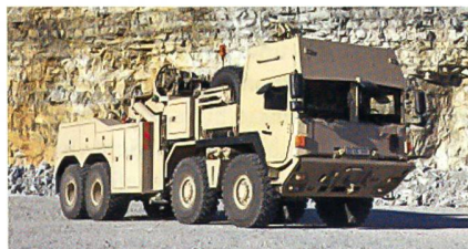
Geschütztes Bergfahrzeug HTRV.

Das rund 36 Tonnen schwere «Heavy Tactical Recovery Vehicle (HTRV)» basiert auf dem bewährten RMMV-SX45-8x8-Chassis und zeichnet sich durch extreme Stabilität, Sicherheit, Komfort und herausragende Beweglichkeit aus – egal, ob auf Strasse oder in schwerem Gelände. Dank des integrierten Miller-Bergeaufbaues ist das RMMV HTRV in der Lage, schwere Schadfahrzeuge mit bis zu 40t Gesamtgewicht oder