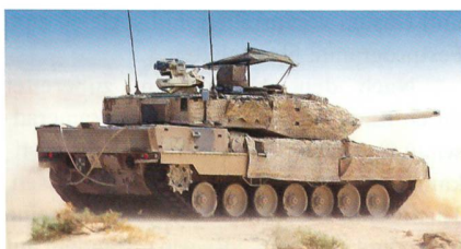
Topmoderne Variante des Leopard 2.

Daher hat Katar mit dem deutschen Wehrtechnik-Unternehmen Krauss-Maffei Wegmann (KMW) einen Vertrag zur Lieferung von 24 Panzerhaubitzen PzH 2000 und 62 Kampfpanzern LEOPARD 2 geschlossen. Das Gesamtvolumen des Projektes, das auch die Lieferung von Peripheriegerät, Ausbildungseinrichtungen und Dienstleistungen umfasst, beträgt 1,89 Milliarden