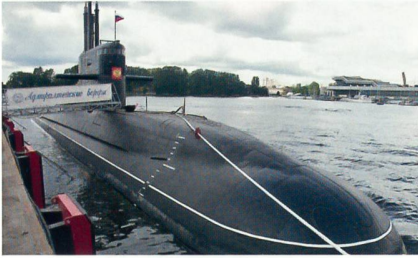
Russisches U-Boot der LADA-Klasse.

Russland und China haben kürzlich einen Vertrag im Wert von zwei Milliarden Dollar über die Lieferung von vier Amur-1650-U-Booten unterzeichnet. Zwei U-Boote sollen in Russland und zwei U-Boote in Lizenz in China gebaut werden. Indien und Venezuela wollen ebenfalls U-Boote dieses Typs von Russland erwerben. Das Amur-A1650