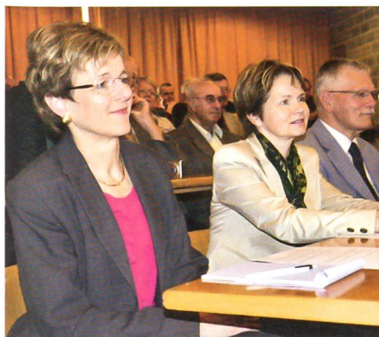
Thurgauerinnen: Nationalrätin Verena Herzog, Ständerätin Brigitte Häberli.