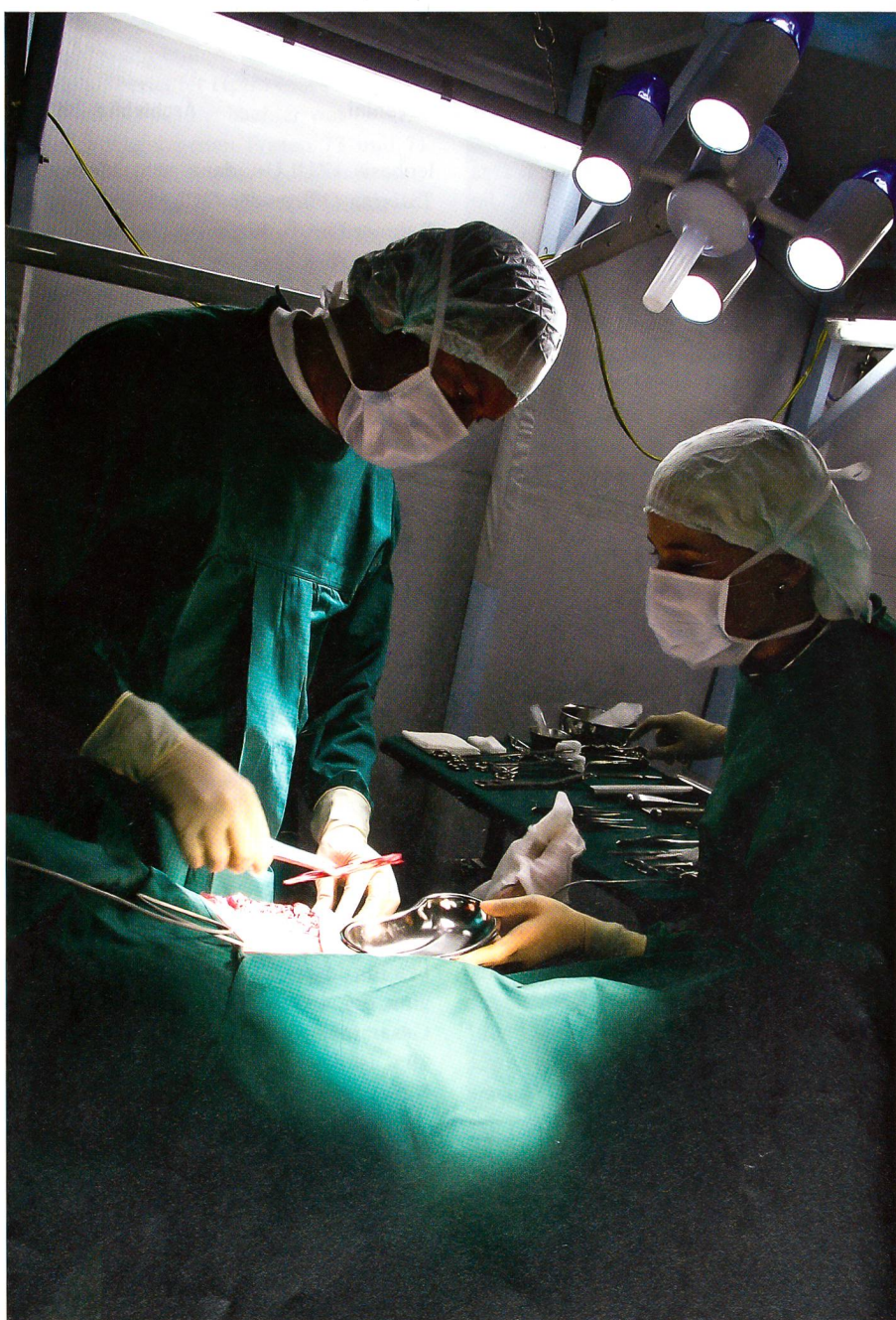
Das Kernstück des mobilen Rettungszentrums: der Operationssaal.

In Szenarien wie grossräumiger Stromausfall, Erdbeben, Überschwemmungen, terroristische Anschläge kann unser ziviles Gesundheitswesen rasch an seine Leistungsgrenzen stossen, insbesondere auch