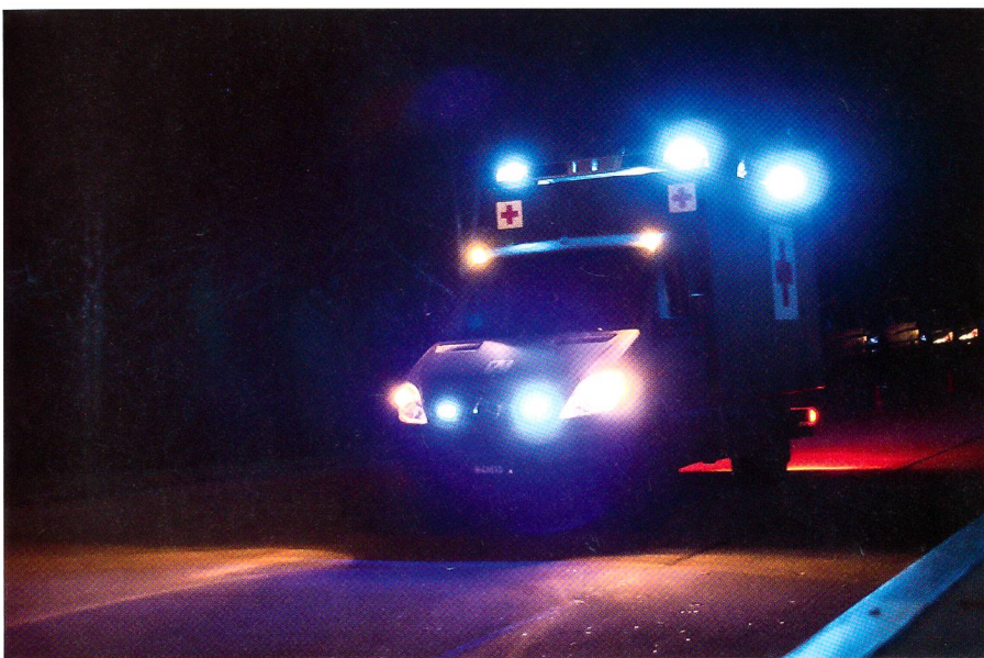
Der Sanitätswagen im Einsatz mit Blaulicht.