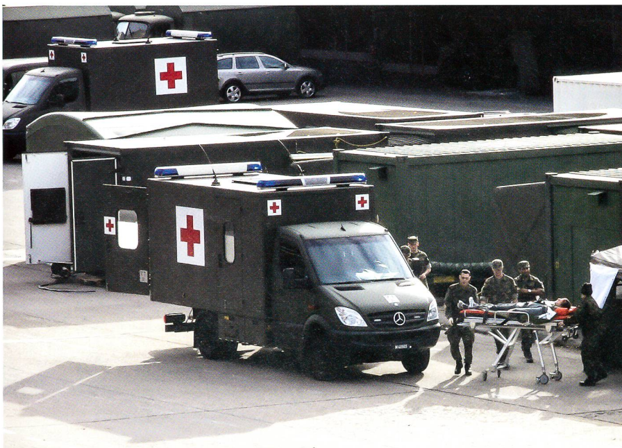
Patientenübergabe bei der mobilen Operationszelle.

dann, wenn Operationssäle nicht mehr einsetzbar sind.