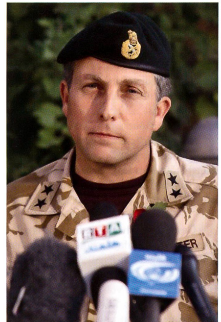
Sir Nicholas Carter, der neue Generalstabschef der britischen Streitkräfte.

In seiner Heimat wurde Carter Kommandant der Feldarmee. Er zeichnete für das Konzept Army 2020 verantwortlich und vertrat dieses auch in der Öffentlichkeit. Bei