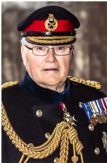
General Sir Peter Wall führt die britische Armee bis September.

Als Divisionskommandant befehligte Carter das ISAF Regional Command South . Im Süden stand er inmitten schwerer Kämpfe. 2009 hielt er fest: «Die Zeit arbeitet nicht für uns.» 2010 kehrte er zurück