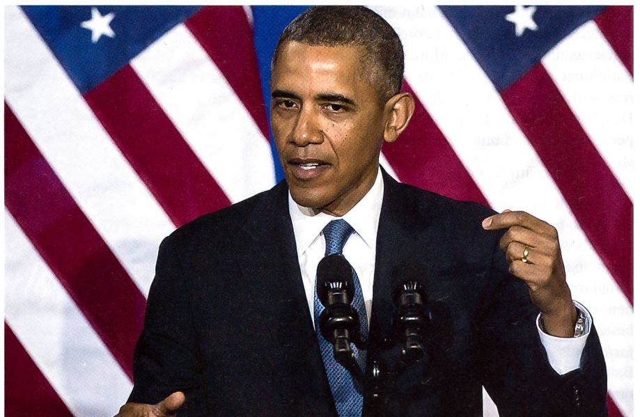
Am 18. Juli 2014 hält Präsident Obama im Weissen Haus seine Rede zu MH17.

Das ist nicht das erste Mal, dass ein Flugzeug über der Ost-Ukraine abgeschossen wurde. In den letzten Wochen schossen