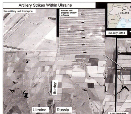
Nochmals Einschläge in der Ukraine und rechts die sechs Raketenwerfer einer russischen MLRS-Batterie in Russland.