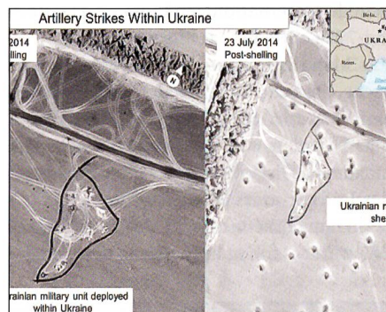
Vorher: Links ukrainische Stellung am 20. Juli vor dem Beschuss. Nachher: Rechts 23. Juli mit Raketeneinschlägen.