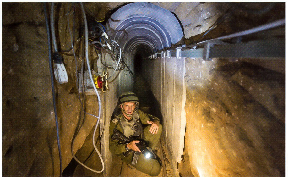
Ein israelischer Major und Sprengmeister in einem 400 Meter langen Tunnel.

Der Geheimdienst weiss: Es ist die libanesische Hisbollah, welche die Hamas im Tunnelbau anleitet. Und es ist die Hisbollah, die den dritten Libanonkrieg vorbereitet. Mehrere Grossverbände suchen die Angriffstunnels, die das Leben der nahen Kibbuzbewohner zur Hölle machten. Wenn die