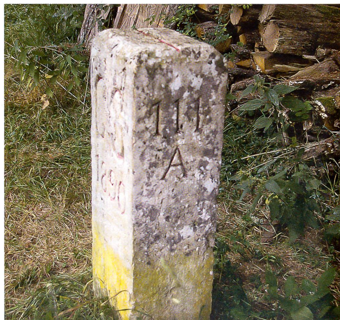
Der historische Grenzstein 0 gleich Grenzstein 111.