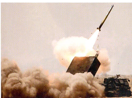
GB-Artillerie: GMRLS, 227 mm, 70 km. Guided Multiple Launch Rocket System.