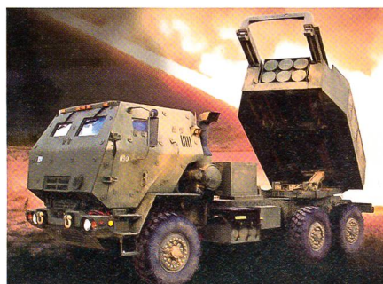
US-Artillerie: HIMARS von Lockheed. High Mobility Artillery Rocket System.