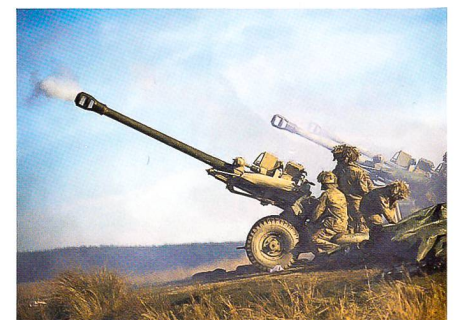
GB: Light Gun, 105 mm, Exportschlager, 8 Schuss/Minute, 20 km, hier ungetarnt.