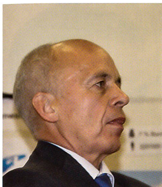
Aufmerksam bei Fragen.