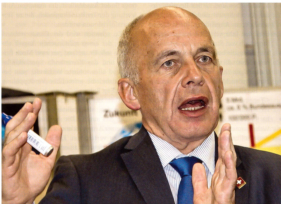
Maurer: «Das Ganze kostet neun Milliarden. Aber das ist vorläufig eine Schätzung.»

Die neue Armee erhält wieder eine erhöhte Bereitschaft. Die Truppe muss sofort bereit sein. Polizei und Feuerwehr halten 24 bis 72 Stunden durch. «Dann ist Ende