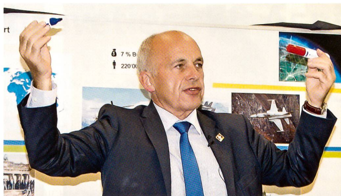
Maurer: «So sieht das Gefecht von F-5 und modernem Jet aus.»