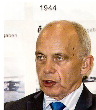
Vor der Wand mit Jahreszahlen.

sein. Man muss die Armee wieder sehen, wieder spüren.