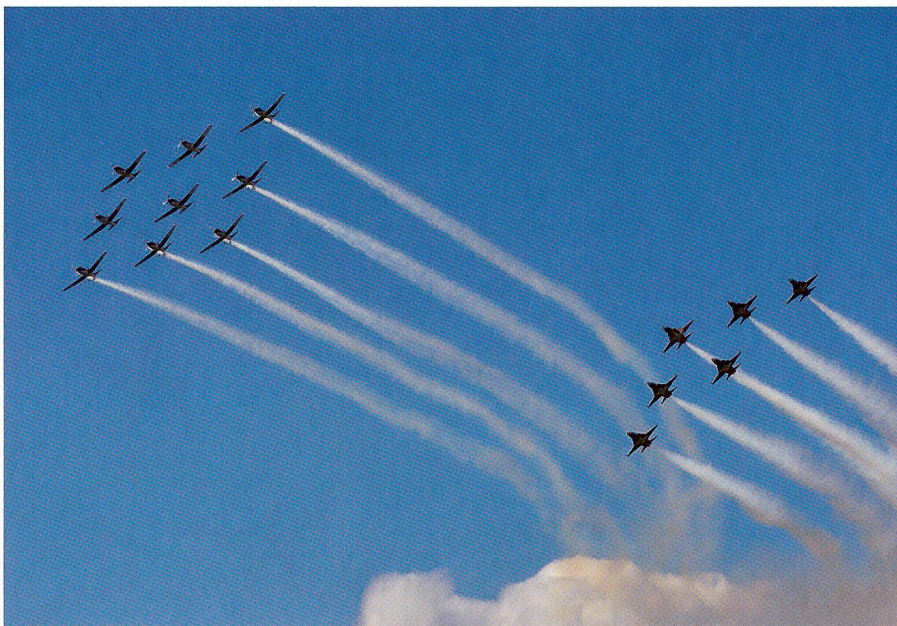
Ein einmaliges Bild von der AIR14: Patrouille Suisse und PC-7-Team gemeinsam!