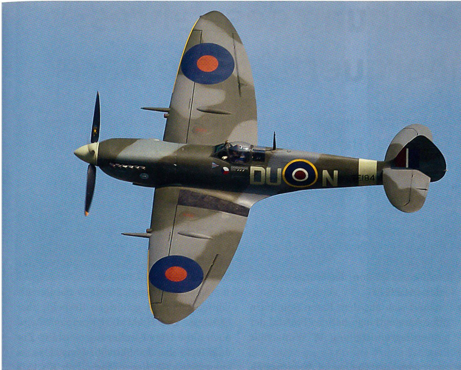
Das britische Jagdflugzeug Spitfire aus dem Zweiten Weltkrieg.

Nachdem zwei Rafale und eine Transportmaschine der französischen Armée de l'Air um 9 Uhr die Startfreigabe für ihren Rückflug zu ihrer Homebase erhalten hatten, fegte eine F-16 Falcon der in Leuwarden stationierten 323. Staffel der Niederländischen Luchtmaacht über die Piste und startete ein atemberaubendes Einzelsdisplay.