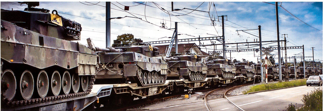
Ein Bild sagt mehr als 1000 Worte: In einem Grosseinsatz bringen die SBB das Pz Bat 13 von Chur/Schwanden nach Luterbach.