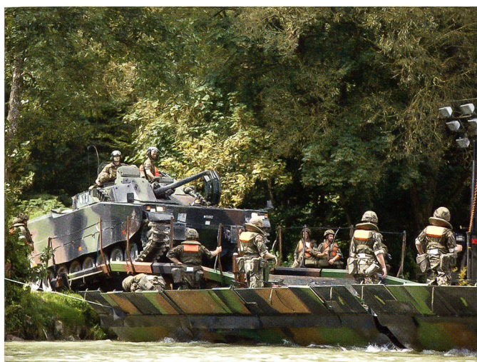
Im Wasserschloss der Schweiz: Ein CV 9030 rollt auf die Fähre.