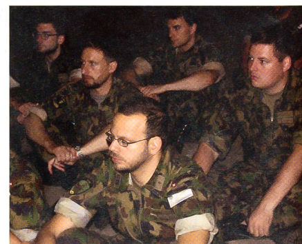
Kader Pz Bat 13 in der Fabrikhalle.