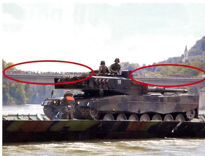
Leopard-2. Man beachte die «Tribüne» auf der Stilli-Brücke.

sonders heiklen Lagen drängt sich die Fähre anstelle der Brücke auf: Die Brücke liegt doch statisch da, während die Fähre beweglich und weniger exponiert ist.