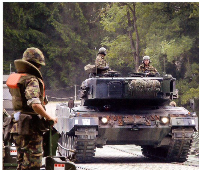
Ein Leopard nach dem anderen erreicht das Südufer der Aare.