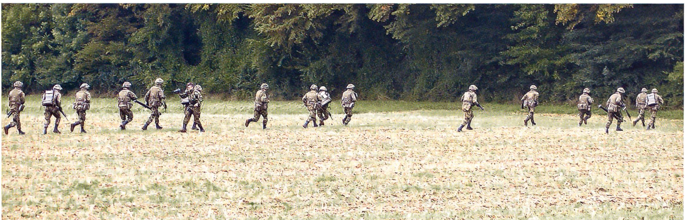
Und noch ein Panoramabild des Fototeams der Pz Br 11: Panzergrenadiere rennen nach Heli-Landung in den schützenden Wald.