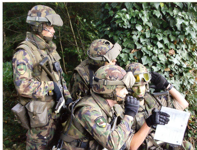
Der Gruppenführer befiehlt: «Dort, hinter das Maisfeld, go!»

Zu diesem Zweck landen 70 Mann der Pz Gren Kp 13/3 und 13/4 heliportiert östlich der Aare. Schon die Landezone hat es in sich: ein Stoppelfeld, nördlich begrenzt von der Limmat-Mündung in die Aare, östlich von der Bahnlinie und der Kantonsstrasse Würenlingen–Untersiggenthal, südlich von der Brücke nach Stilli und westlich von einem schmalen, dichten Wald an der Aare.