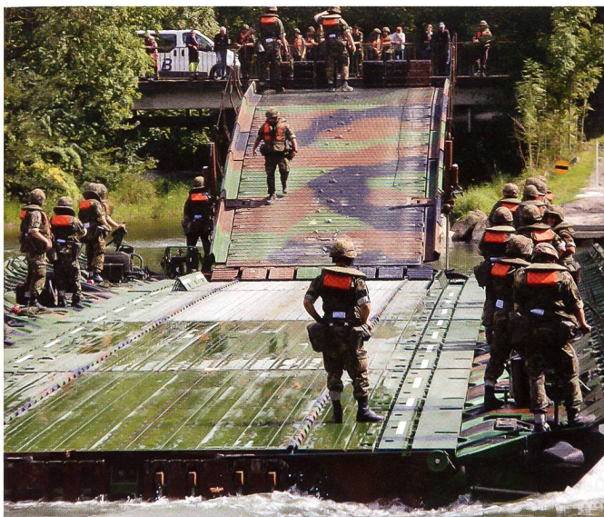
Wildegg: Pontoniere fahren die Schwimmbrücke zur Anlegestelle.