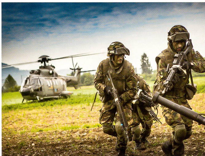
Nach der Heli-Landung sammeln sich die Panzergrenadiere.