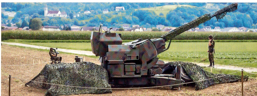
Die 35-mm-Flab-Kanone oben gut getarnt und unten ungetarnt schussbereit.

und Bankkader bei der CS in Zürich. In der Truppe war leichter Unmut zu spüren, weil die Übung mehrmals wiederholt wurde. Es rächte sich, dass die Einheit seit Jahren erstmals wieder an einer VTU teilnahm, weil sie am WEF Einsatz leistete oder einen Schiesskurs bestand. Der LVb hat den Mangel erkannt und vor drei Jahren zu Recht entschieden, dass die Einheiten ihren WK alternierend am WEF, in einem Schiesskurs und in einem taktischen WK zu leisten haben, um die Batterien auch im Rahmen von VTU