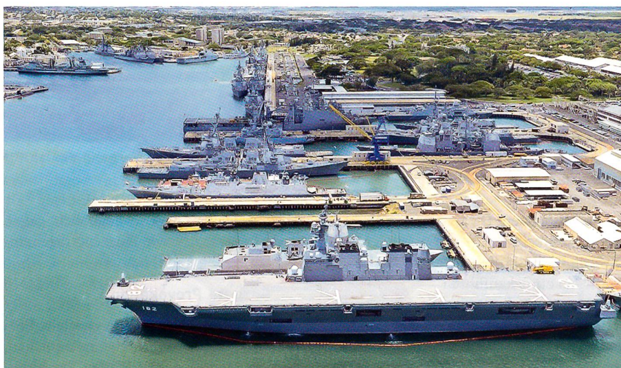
Zu Beginn von RIMPAC 2014 fanden sich alle 49 Einheiten der 22 Marinen im überfüllten Pearl Harbor ein. Vorne der japanische Helikopterträger Ise.

lei Hinsicht ein Interesse an der regulären Teilnahme zu haben. Einerseits demonstriert es damit sein offensichtliches Bemühen, die Wahrnehmung einer aggressiven maritimen Politik Chinas bei den Anrainern und den USA durch vermehrten Goodwill zu korrigieren.