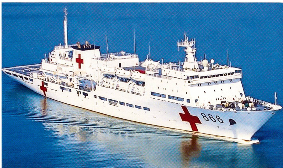
Peace Ark nahm mit drei weiteren chinesischen Schiffen erstmals an RIMPAC teil.

Trotz den Konflikten im Ost- und Südchinesischen Meer scheint China in zweier-