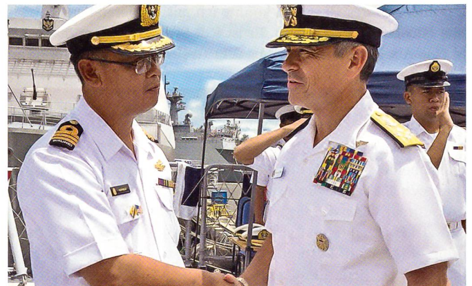
Der Befehlshaber der amerikanischen Pazifikflotte, Admiral Harris (rechts), unterhält sich mit einem Offizier aus Brunei.