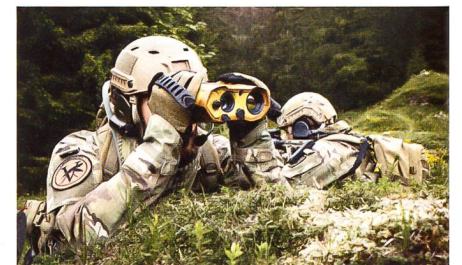
Neues Beobachtungs- und Lokalisierungsgerät MOSKITO TI von Vectronix/Sagem.

Das handliche MOSKITO TI bietet bei kompakten Ausmassen folgende Hauptfunktionen: Eine Wärmebildkamera mit weitem Sichtfeld zum schnellen Entdecken, eine LLCMOS-Kamera für sichere Identifizierung bei Tag und Nacht, ein Laserdistanzmessgerät, einen Direktsichtkanal für