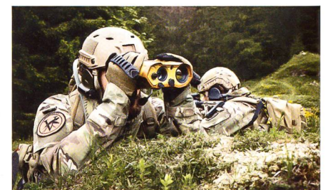
Neues Beobachtungs- und Lokalisierungsgerät MOSKITO TI von Vectronix/Sagem.

Das handliche MOSKITO TI bietet bei kompakten Ausmassen folgende Hauptfunktionen: Eine Wärmebildkamera mit weitem Sichtfeld zum schnellen Entdecken, eine LLCMOS-Kamera für sichere Identifizierung bei Tag und Nacht, ein Laserdistanzmessgerät, einen Direktsichtkanal für