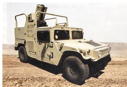
SOLTAM SPEAR auf Geländefahrzeug.

Elbit Systems hat ein neues autonomes Recoil Mortar System (RMS) SOLTAM SPEAR für leichte Gefechtsfahrzeuge vorgestellt. Es soll die Rückstosskräfte eines 120-mm-Mörser von 30 auf 10 Tonnen reduzieren. Dadurch eignet sich das System auch für den Einsatz auf leichten 4x4-Gefechtsfahrzeugen und erhöht Beweglichkeit und Kampfkraft der infanterieeigenen Steilfeuerkomponente. Durch sein leichtes, modu-