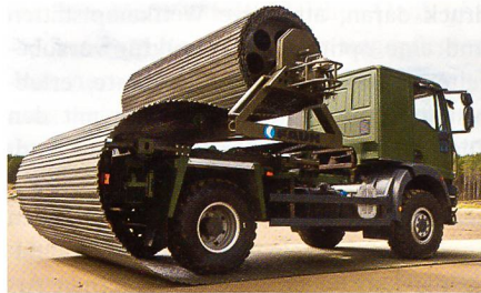
Faun Trackway auf Lastwagen.

Die dänische Beschaffungsorganisation DALO erhält von Faun Trackway transportable Systeme zur Herstellung/Erhaltung der Befahrbarkeit von wenig tragfähigen Wegen. Für die Rollstrasse mittlerer Tragfähigkeit hat Faun Trackway ein Verlegesystem