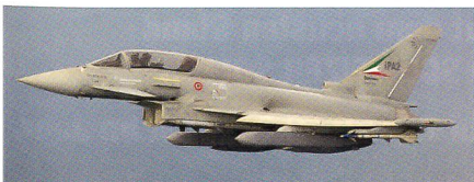
Testflug eines italienischen Eurofighters mit der Abstandswaffe Storm Shadow.

Die Storm-Shadow-Lenk Waffen sind an den inneren Aufhängen unter dem Flügel des Eurofighters angebracht. Bei dem Testflugzeug handelt es sich um den italienischen Eurofighter Instrumented