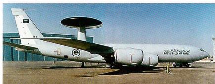
KE-3A Sentry der saudischen Luftwaffe.

Saudi-Arabien will ihre fünf KE-3A-Sentry-AWACS-Frühwarnflugzeuge mit modernster Elektronik und Computersystemen nachrüsten, dahingehend wurde der US-amerikanische Kongress informiert. Falls die Nachrüstung der AWACS-Flugzeuge Saudi-Arabiens vom Kongress befürwortet wird, käme der neue Auftrag auf einen Wert von zwei Milliarden US-Dollar zu stehen. Neben modernsten Computersystemen und einem neuen Freund/Feind-Erken-