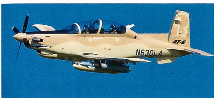
Leichtes Erdkampfflugzeug AT-6C Texan II.

Die USA und der Irak haben einen Vertrag über den Kauf von Waffen über einen Gesamtwert von rund 1 Mia. US-Dollar abgeschlossen. Den grössten Posten stellen dabei 24 leichte Erdkampfflugzeuge vom Typ AT-6C Texan II im Gesamtwert einschliesslich ergänzender Ausrüstung sowie Versorgungsdienstleistungen von 790 Mio. US-Dollar. Das von Beechcraft hergestellte