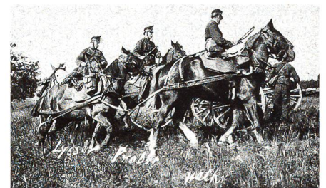
Stellungsbezug 1913 in der RS Bière.

Da mein Vater 1913 seine RS als Fahrer bei der Feldartillerie absolvierte und bis