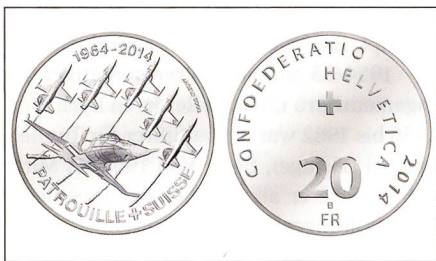
Beide Seiten der Jubiläumsmünze.

Die Kunstflugstaffel unserer Luftwaffe hat sich zu einem Markenzeichen der Schweiz und ihrer sprichwörtlichen Präzi-