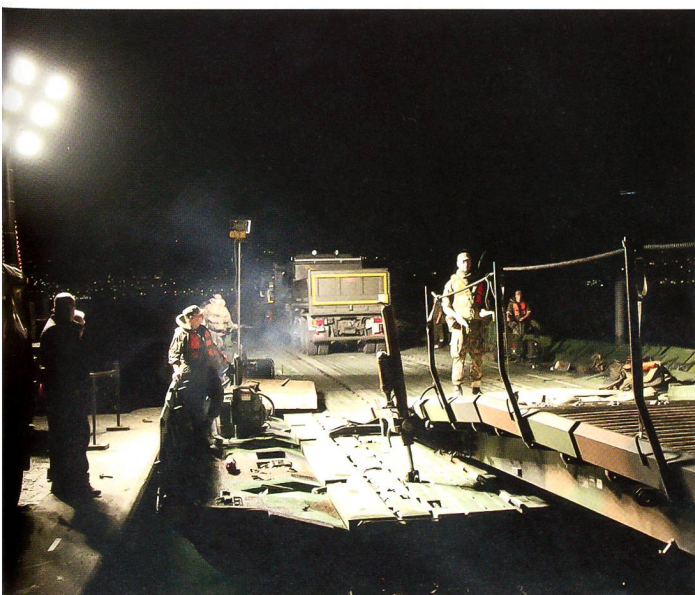
Das erste Fahrzeug ist verladen, weitere folgen.

Neben den erwähnten Aufträgen und Übungen bewährte sich die Kompanie an der Volltruppenübung «PONTE» der Panzerbrigade 11. +