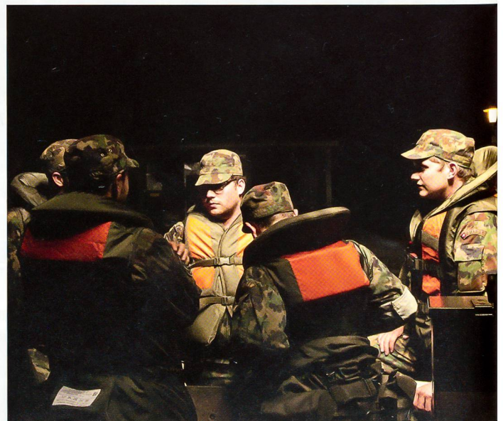
Letzte Absprachen vor dem Verlad der Fahrzeuge.