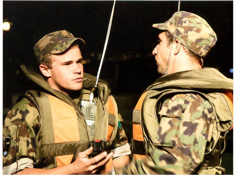
Sicherheit vor allem: Nichts wird dem Zufall überlassen.

tempo befahren. Die Pontoniersoldaten an den permanent laufenden Bootsmotoren müssen während des Befahrens der Fähre durch die Fahrzeuge laufend die Bewegungen der Schwimmbrücke 95 ausgleichen.