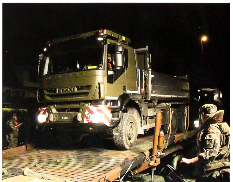
Ein Iveco Trakker wird eingewiesen.