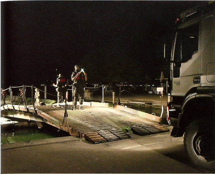
Die Schwimmbrücke 95 liegt bereit zum Verlad der Fahrzeuge.