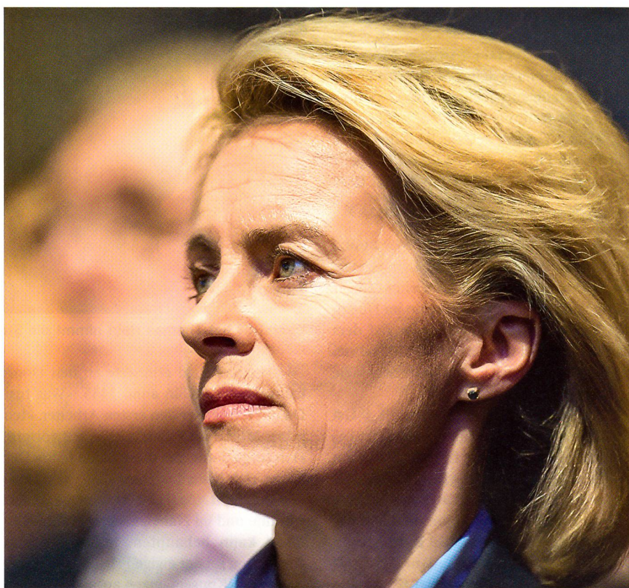
Verteidigungsministerin Ursula von der Leyen, im Amt seit dem 17. Dezember 2013.