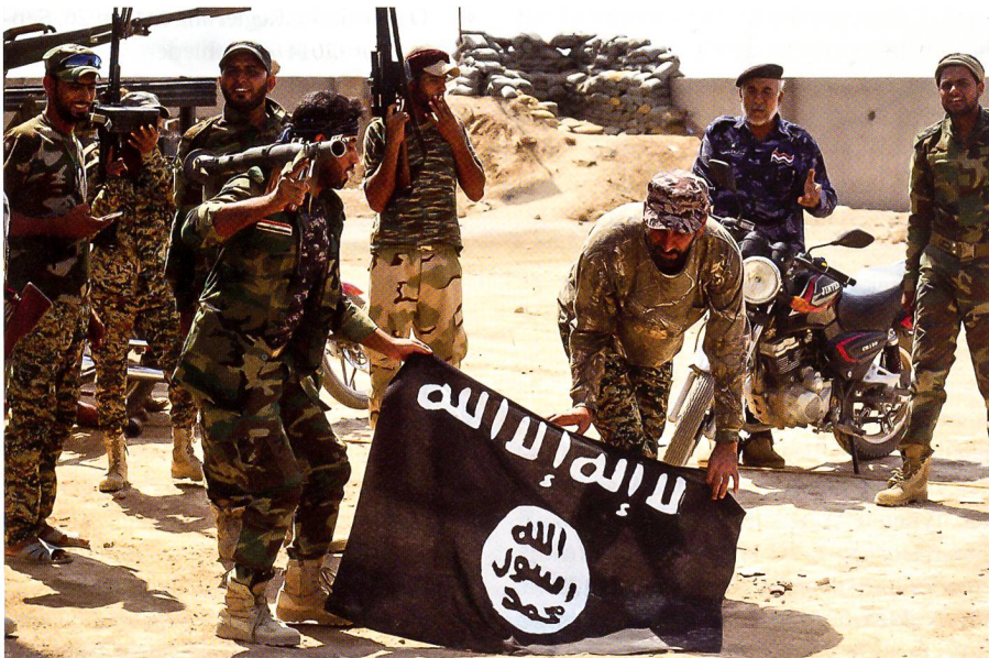
Irakische Truppen zeigen triumphierend eine eroberte Flagge der ISIS-Milizen.