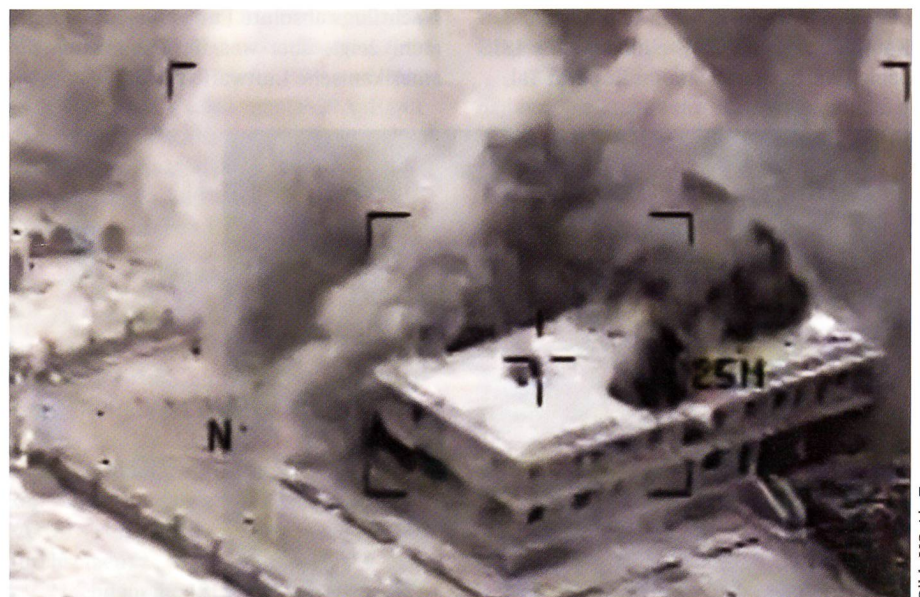
Bei einem Luftangriff der US Air Force wird ein Gebäude bei Abu Kamal getroffen.