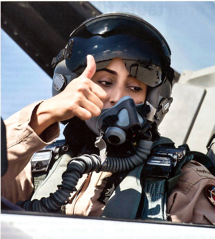
Mariam Al Mansouri ist Mirage-2000-Kampfpilotin der Luftwaffe der Vereinigten Arabischen Emirate. «Lady Liberty» flog auch Angriffe gegen die ISIS-Terroristen.

rien gegen 33 Ziele und 1414 Luftangriffe gegen 209 Ziele in Irak geflogen. All diese Einsätze wurden durch 1289 Tankermis-sionen unterstützt. Die Einsätze sind dadurch begünstigt worden, als die syrische Luftver-teidigung entweder «kooperiert» hat, das bleibt offen, vor allem aber deshalb, weil diese im Nordosten Syriens nicht beson-ders dicht ist.