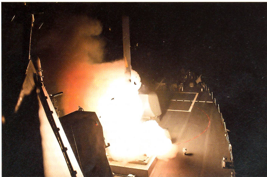
Ein Marschflugkörper des Typs Tomahawk wird am 23. September 2014 im Roten Meer vom Raketenzerstörer USS Arleigh Burke gegen ISIS-Ziele gestartet.