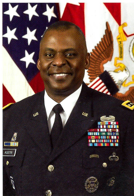
General Lloyd A. Austin ist Chef des US Central Command und damit für die Kriegführung gegen den IS verantwortlich.

US Air Force mit Maschinen der Air Expeditionary Wings 379th in Al Uded (Qatar), 380th in Al Dhafra (UAE), 386th in Ali Al Salem (Kuwait), 438th in Kabul (Afghanistan) und 455th in Bagram (Afghanistan).