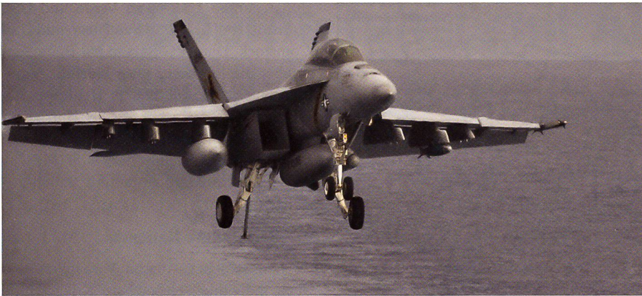
Eine F/A-18E Super Hornet der Fighter Attack Squadron 213 kehrt auf den Flugzeugträger USS George H.W. Bush (CVN 77) zurück.