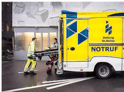
Nach 15 Minuten ist die Ambulanz da.