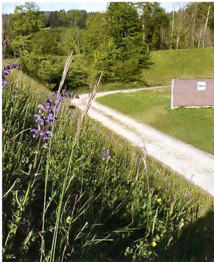
Eine unbekannte Seite des Waffenplatzes St. Gallen: Blühbeginn der Wiesensalbei in der Kurzdistanz-Anlage.

Doch wo finden sich solche Wiesen vor den Toren der Städte St. Gallen und Goss-