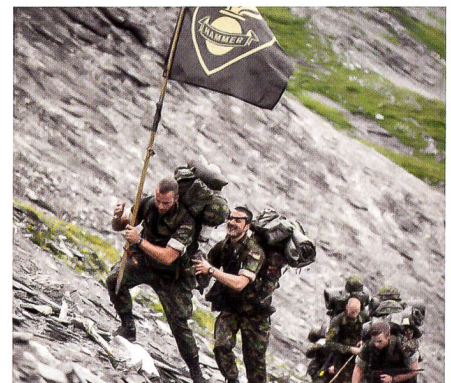
Wie einst Suworow: Die Pz Gren Kp 13/3 überquert den Panixer