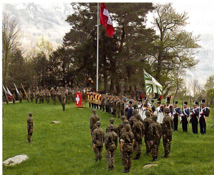
Planungssicherheit für die Truppe!

Die Sicherheitspolitische Kommission des Ständerates will der Armee eine verlässliche Finanzplanung ermöglichen. Deshalb soll im Militärgesetz eine Grundlage für einen Zahlungsrahmen über mehrere Jahre für die Armee geschaffen werden. Dieses Instrument hat sich im Rahmen der Finan-