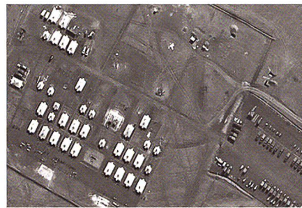
Eines der veröffentlichten Bilder.

Natürlich haben wir dem russischen Botschafter, Andrej Kelin, nicht geglaubt, dass Russland die Rebellen in der Ostukraine