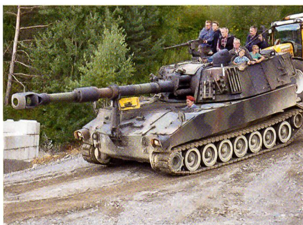
Die Panzerhaubitze M109 in Fahrt.

«Wir hatten absolut keine Ahnung, wie viele Zuschauer zu diesem ersten Oldie-Treffen von Militärfahrzeugen kommen,