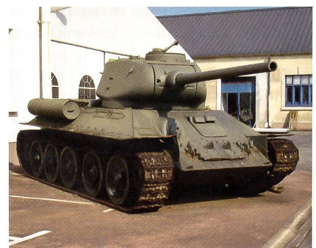
Sowjetpanzer des Weltkriegs: T-34.

Hätte die Tagesschau-Redaktion kurz das Internet konsultiert, hätte sie festgestellt: Der sowjetische Panzer des Zweiten Weltkriegs war der T-34, welcher der deutschen Wehrmacht vom Dezember 1941 an schwere Niederlagen zufügte. Der T-34 ist gut zu erkennen am charakteristischen Turm und der 76,2-mm-Kanone. Von der T-54-Familie unterscheidet er sich deutlich!