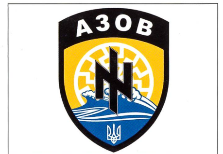
Der Badge eines ukrainischen Bataillons.

Kann mir mal jemand erklären, wieso ausgerechnet ein als «Nazi-Bataillon» bekannter