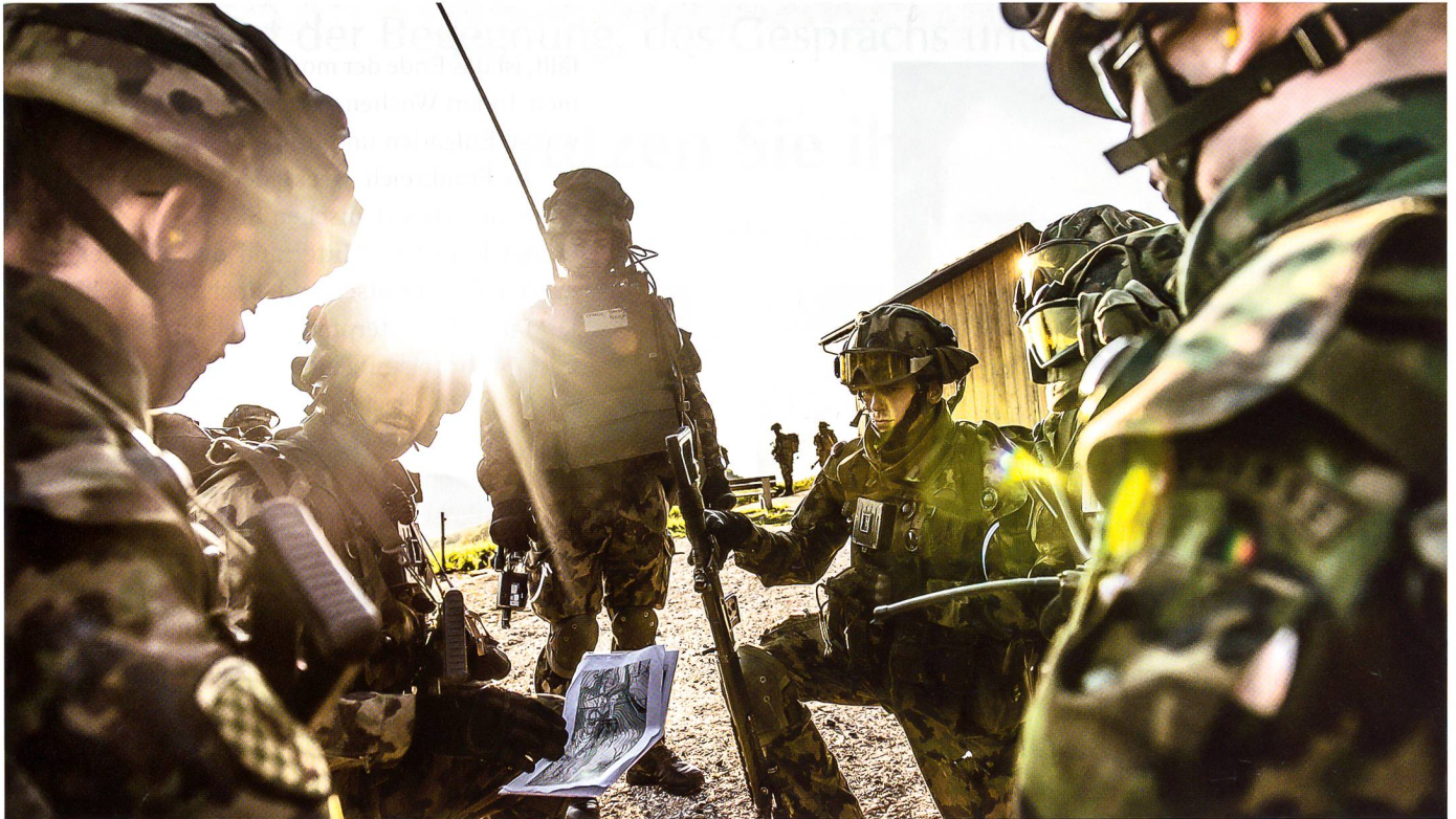
Spl Spittelberg, frühmorgens, Tag 6 der Durchhalteübung «HERCULES» (Inf OS). Ein Zug Infanteristen beurteilt in der ersten Morgenwärme die Lage und bricht auf, um einen Zugriff zu unterstützen.