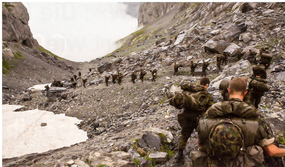
Konzentrierter Abstieg bei Nebelschwaden und baldigem Niederschlag.