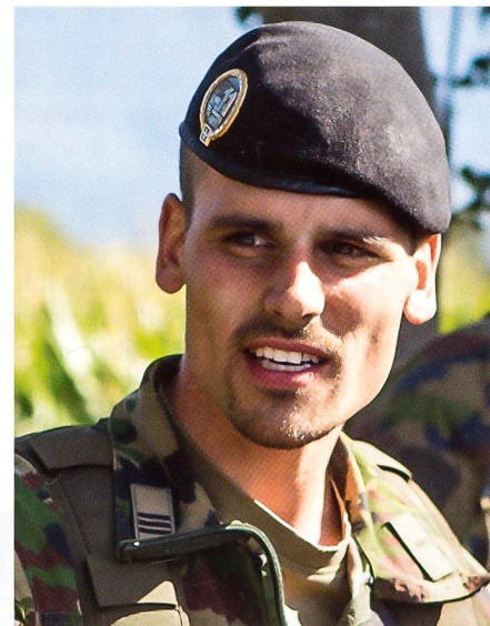
Energischer Kp Kdt vor dem Abmarsch.