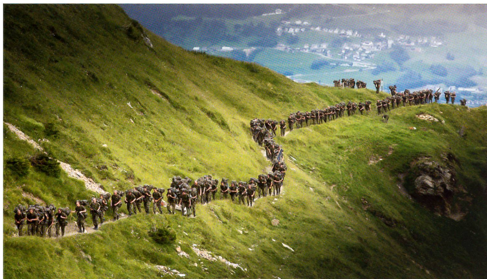
Aufstieg Richtung Panixerpass in Einerkolonne und mit Vollgepäck.