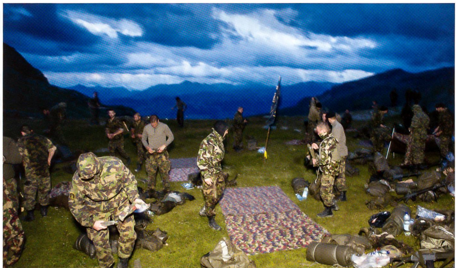
Aufbruch im Morgengrauen – Reorganisation kurz vor dem Abmarsch.

Die breit gestreuten Blessuren des Vortages und der anhaltende Regen erschwerten den Abstieg zusätzlich. Glücklicherweise, aber