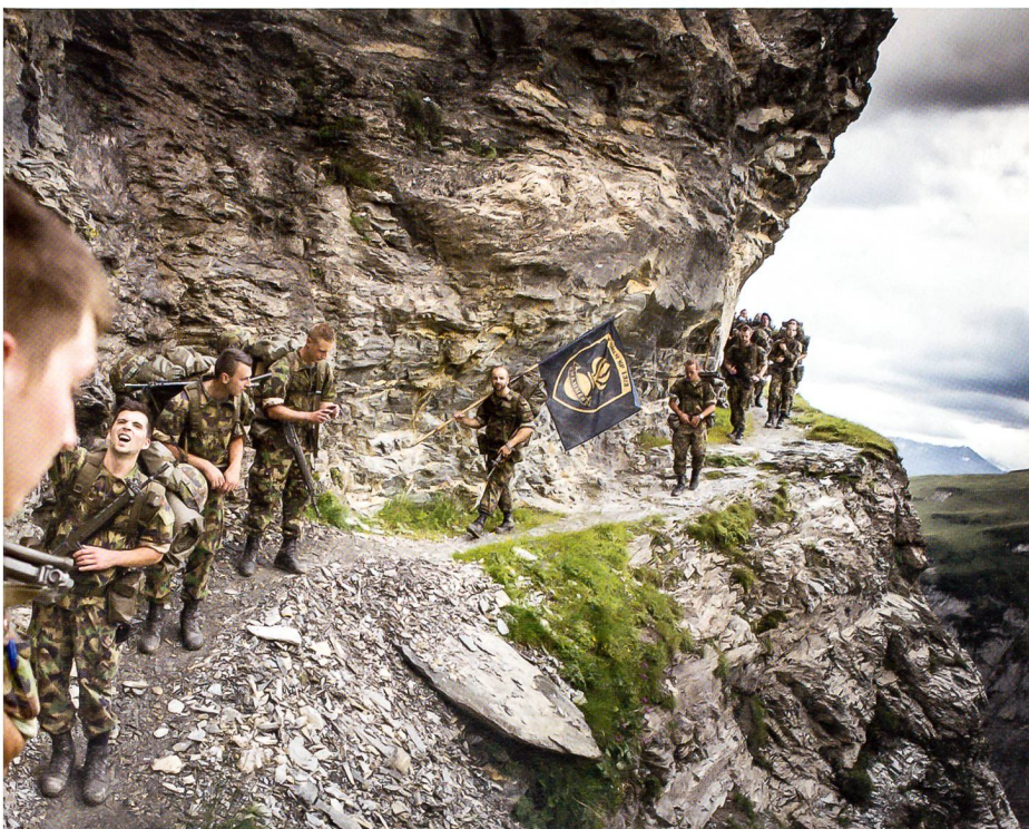
Im Aufstieg zum Panixer: Die Männer der HAMMER-Kp müssen schwindelfrei sein.

Die Lastwagen wurden bis auf den letzten Platz gefüllt und spedierte die Truppe in zweistündiger Fahrt nach Panix an den Fusse des Passes. Der letzte Abschnitt glich einem abenteuerlichen Wald-