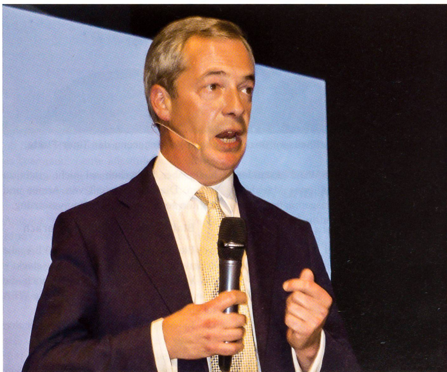
Der Brite Nigel Farage bei seiner Rede.