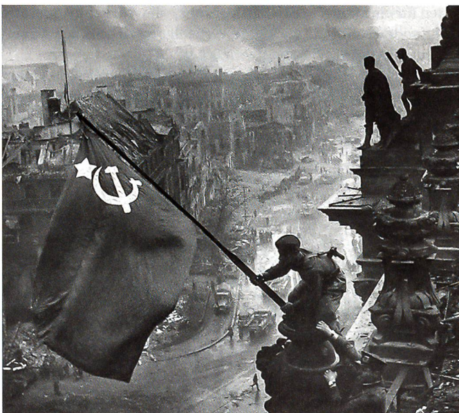
Berlin, 2. Mai 1945: Über dem Reichstag hisst ein Russe die Rote Fahne. Er trug mehrere Uhren, das Bild ist nachgestellt.