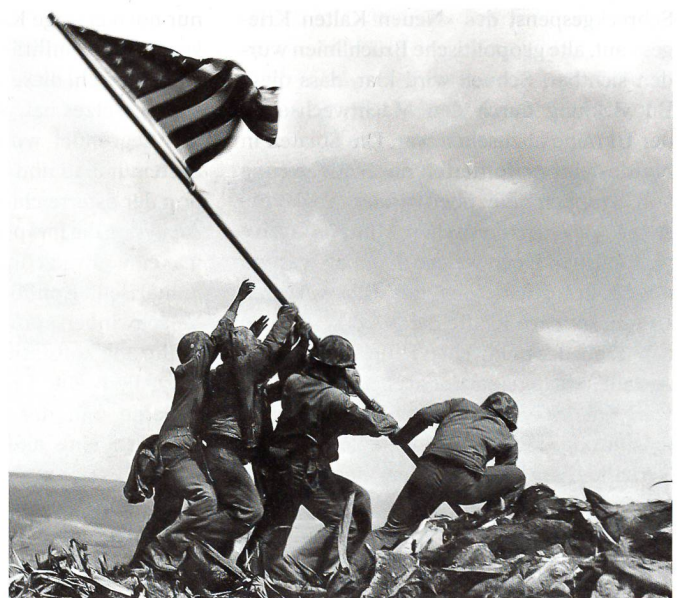
Pazifikkrieg, 23. Februar 1945: Amerikaner hissen auf Iwojima das Sternenbanner. Auch diese Bildikone ist nachgestellt.