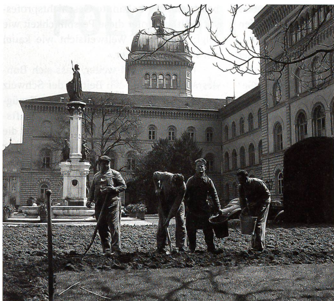
Anbauschlacht: Ackerbau überall, sogar vor dem Bundeshaus.