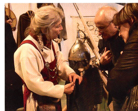
An der Waffenbörse in Lausanne.

Das Sportschiessen ist eine der meistpraktizierten Aktivitäten in der Welt. Das Publikum hat so die Möglichkeit, das Bogenschiessen, das Luftgewehr und die Druckluftpistole zu entdecken und zu testen. Die Veranstaltung zählt mehr als 90 Fachaussteller verteilt auf über 5000 m 2 in