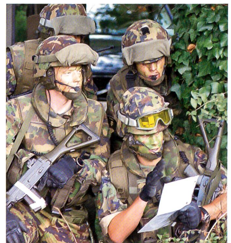
In jeder Armee bilden Unteroffiziere und Subalternoffiziere das Rückgrat