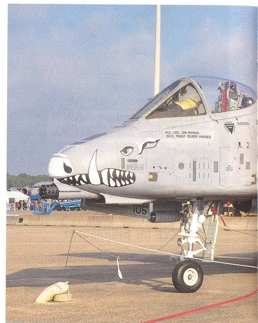
Das mit einer 30-mm-Gatling-Kanone ausgerüstete Seymour-Johnson AFB. Es war zur Bekämpfung