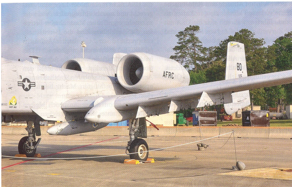
te Kampfflugzeug A-10C Thunderbolt II wird ausser Dienst gestellt, hier eine Aufnahme von ng sowjetischer Panzerverbände auf einem Kriegsschauplatz in Europa gebaut worden.