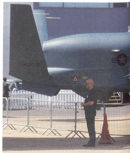
Anstelle der ausser Dienst zu stellenden U-2S-A