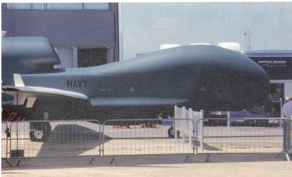
ufklärungsflugzeuge sollen zusätzliche Global-Hawk-Drohnen zum Einsatz kommen.

rungsmaschinen; letztere sollen durch den vermehrten Einsatz der Aufklärungsdrohne RQ-4B Global Hawk ersetzt werden;