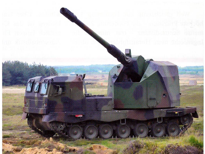
Das deutsche Geschütz DONAR von Krauss Maffei Wegmann. Es ist eine Weiterentwicklung der Panzerhaubitze 2000.