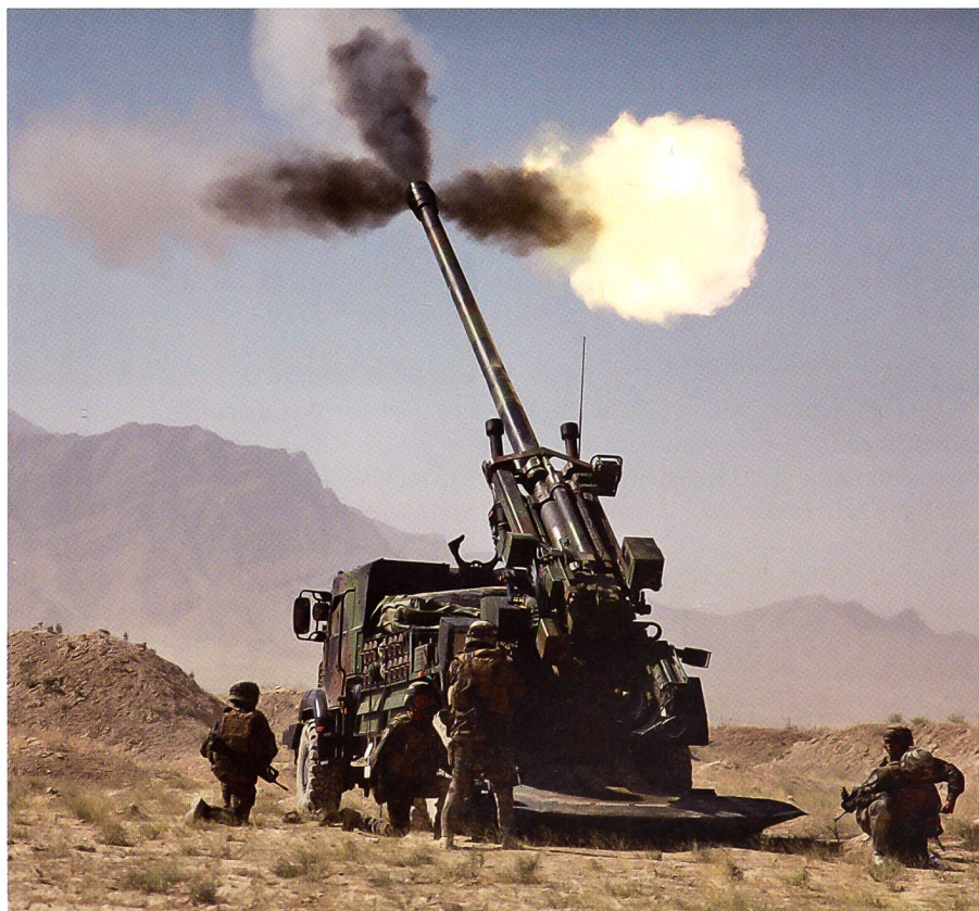
Das französische System CAESAR. Man beachte, wie ungeschützt die Mannschaft ist.

Das Feuer aus allen Rohren wird entweder die Ausnahme bilden oder sogar der Vergangenheit angehören. Die neue Präzision im Halbbatterie- oder Einzelschuss verlangt im Gesamtsystem Artillerie Fortschritte in allen Sparten. Direkt betrof-