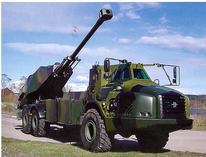
Das schwedische 155-mm-Artilleriesystem ARCHER von Bofors. Schweden und Norwegen führen ARCHER jetzt ein.