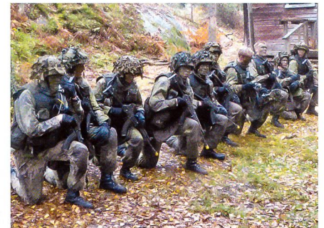
Eine Marines-Gruppe nach dem Angriff.