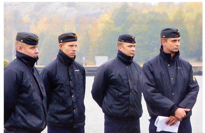
Finnische Offiziere des 7. Raketenschnellbootgeschwaders.