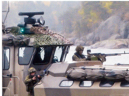
Feuerschutz für die landenden Marines.