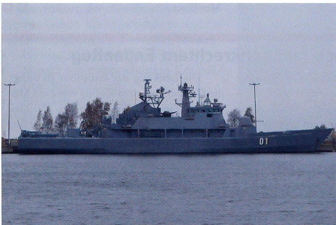
Das finnische Minenkampfschiff (Minenleger) Pohjanmaa 01.