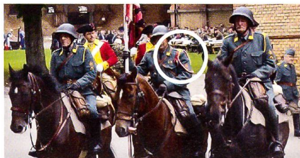
Schnüre gehören auf die rechte Schulter.

Es würde mich freuen, einen entsprechenden Artikel mit Bild in der nächsten