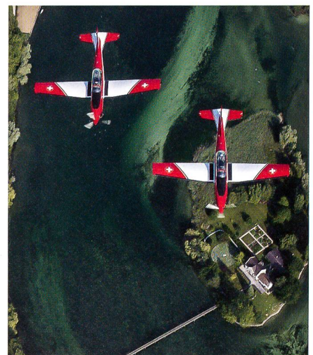
Der Prachtsband zu 100 Jahre Luftwaffe.