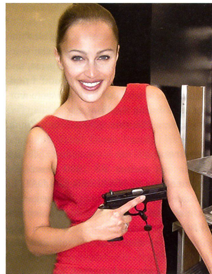
Am Ceska-Stand im Jahr 2012.

Als Ergänzung zu Seite 59 der Dezember-Ausgabe: Auch mir ist der Stand der tschechischen Firma Ceska anlässlich des EMPA-Kongresses in Prag aufgefallen.