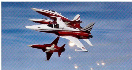
Die Patrouille Suisse am Himmel.

Blicken Sie hinter die Kulissen und lernen Sie die Teammitglieder kennen. Steigen Sie ein und erleben Sie die Sichtweise der