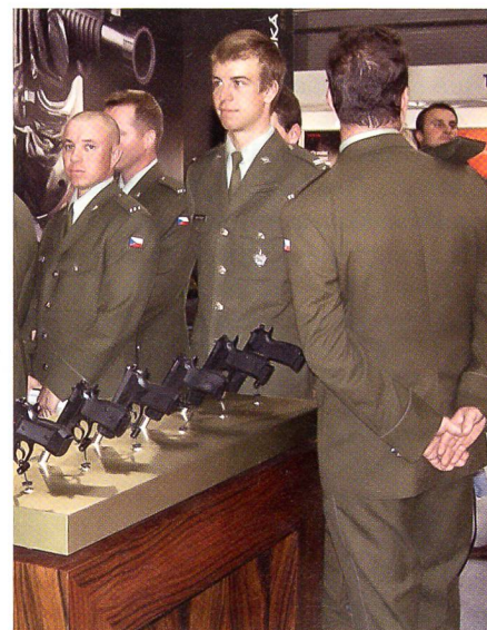
Tschechische Kader bei Ceska.

Die Vermutung, dass die Schnur an der Waffe angebracht wurde, um Diebstahl zu verhindern, ist richtig. Jedermann konnte die Waffen in die Hand nehmen, genau be-