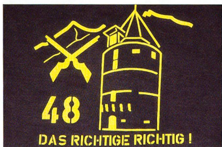
Das Leitwort des Geb Inf Bat 48.

Ich danke ganz herzlich für die prominente Plattform im SCHWEIZER SOLDAT, die sie der Berichterstattung über das Geb Inf