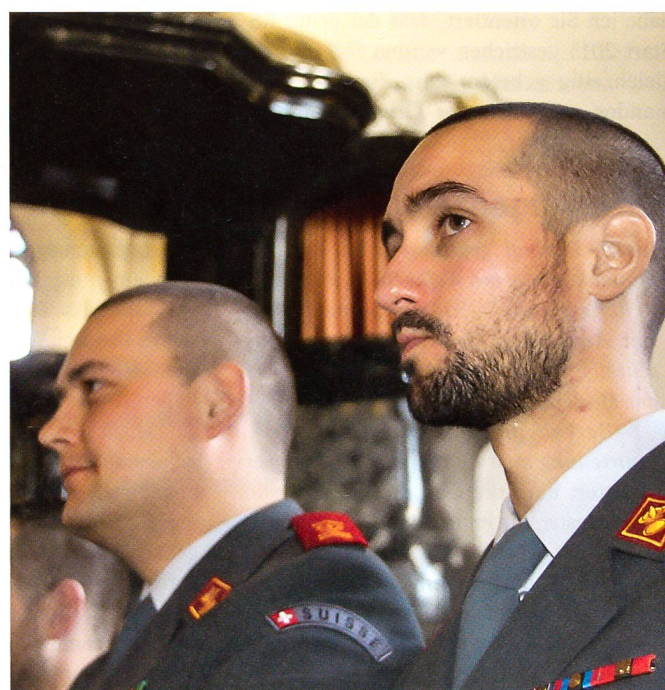
Aufmerksame neue Adjutanten in der schönen Kirche Herisau.