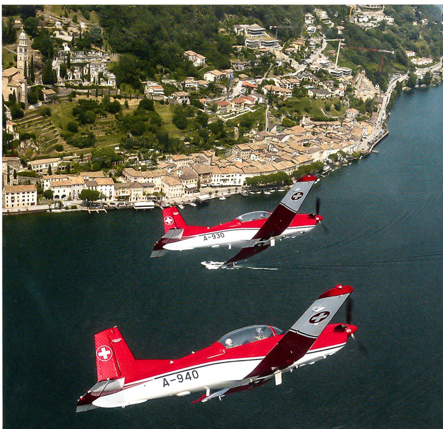
Morcote: Ein Prachtsbild aus einem Band mit vielen gestochen scharfen Bildern.

Hansjörg Bürgi, Verleger, bedankte sich seinerseits für die herausfordernde Aufgabe der Herstellung des Jubiläumsbandes. Er äusserte sich zu den Fotos, zum Layout und zum Papier. Während Teil 1 auf weissem Papier gedruckt wurde, kam bei