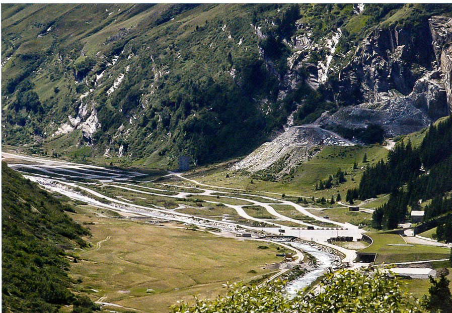
In Graubünden befindet sich auch der bewährte Schiessplatz Hinterrhein.