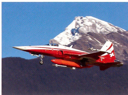
Ein Tiger der Patrouille Suisse.