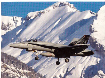
Ein F/A-18 vor den Walliser Alpen.