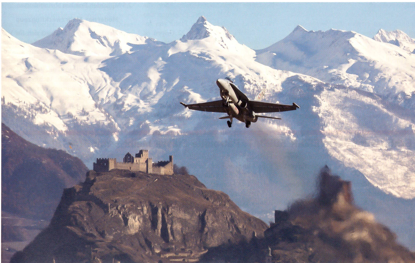
Da schlägt jedem Sion-Freund das Herz höher: F/A-18, Tourbillon, Valère im Schweif des F/A-18 und die schneebedeckten Alpen.