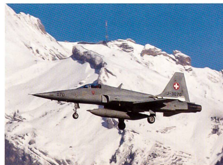
Ein F-5 Tiger im Landeanflug auf Sion.