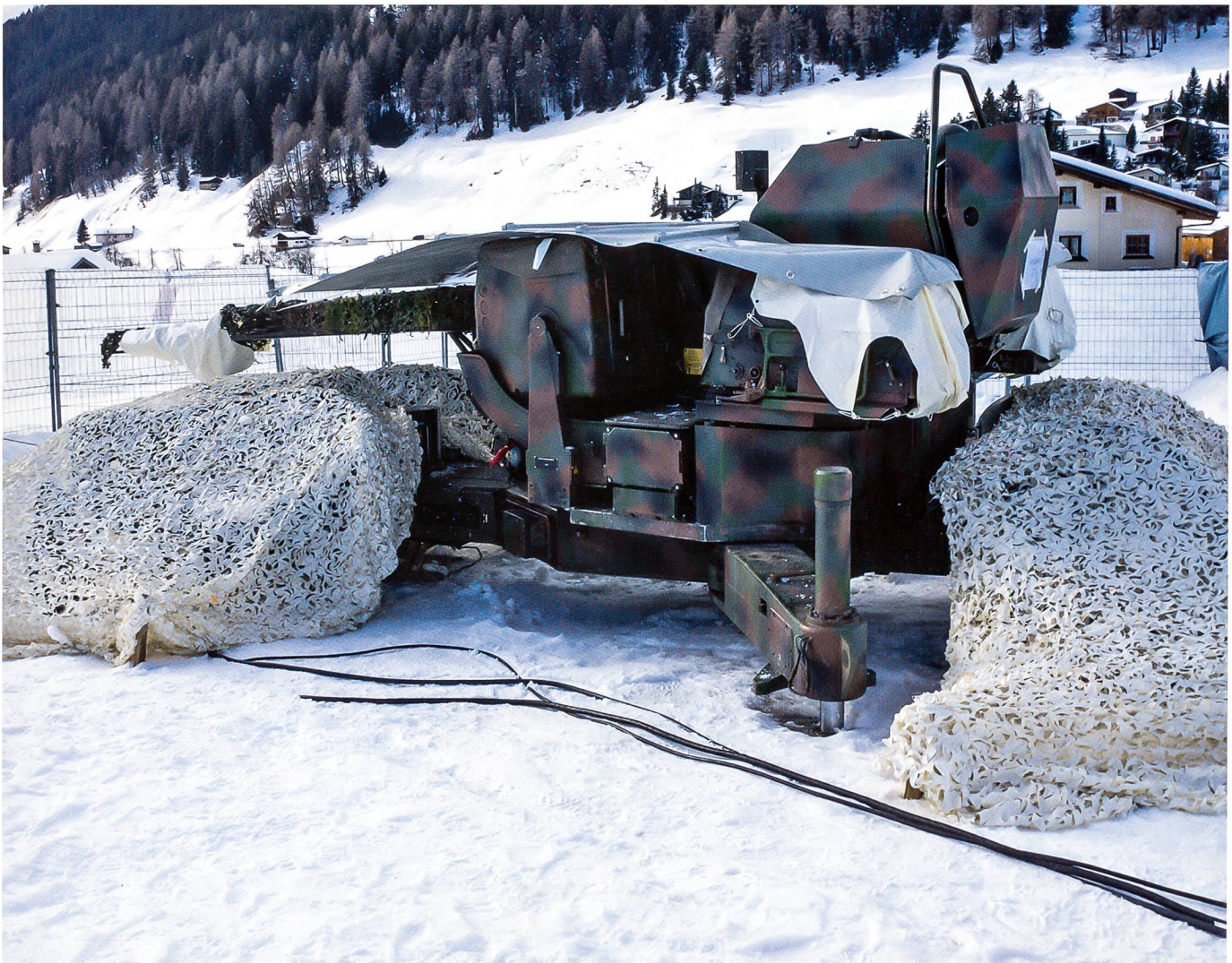
Die Mobile Flab-Kanone 35 Millimeter in Stellung. Im Schnee gegen Luftsicht getarnt in Weiss.