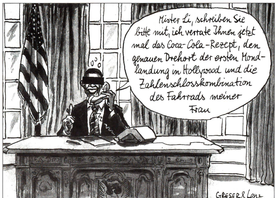
Volkssport Verrat: Ist Amerika verrückt geworden?

Betriebsleistungen für kritische und zentrale Infrastrukturen der Bundesverwaltung sollen an Unternehmen vergeben werden, die ausschliesslich unter Schweizer Recht handeln, sich zur Mehrheit in Schweizer Eigentum befinden und ihre Leistung gesamtheitlich in Schweizer Betrieben erzeugen.