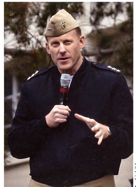
Vizeadmiral Michael S. Rogers übernimmt von Keith Alexander die NSA.

Im Rahmen seiner letzten Verwendung kontaktierte er immer wieder die Verbände der U.S. Navy weltweit, um sich über deren Erfahrungen im Bereich des Cyber Warfare