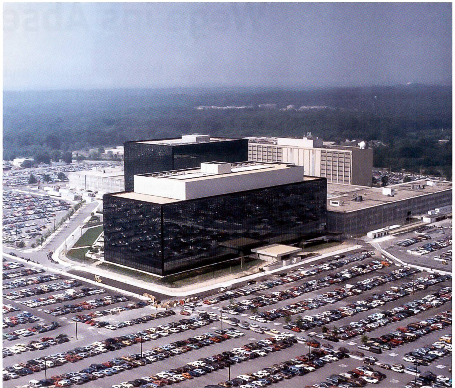
Das NSA-Hauptquartier in Fort Meade, nördlich von Washington. Die NSA beschäftigt 35 000 Mitarbeiterinnen und Mitarbeiter.