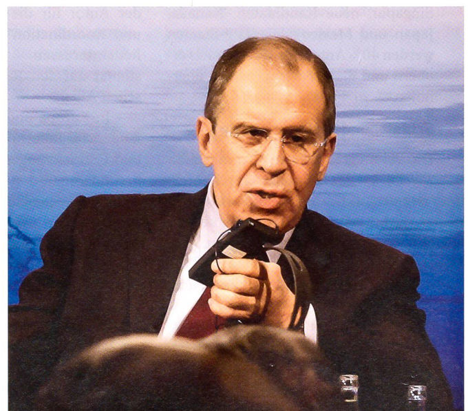
Kerrys Gegenspieler, der Russe Lawrow, hielt hart dagegen.