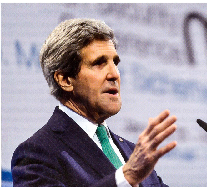
John Kerry erwies sich wie am WEF in als begnadeter Redner.

Kerry wörtlich: «Die Vereinigten Staaten und die Europäische Union stehen zum ukrainischen Volk.» Und an Russlands