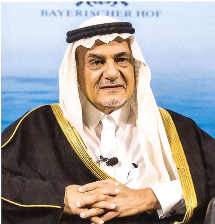
Prinz Turki al-Faisal bin Abdulaziz al-Saud vertrat Saudi-Arabiens Interessen.