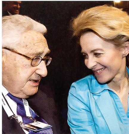
Ex-Staatssekretär Kissinger und Verteidigungsministerin Ursula von der Leyen.