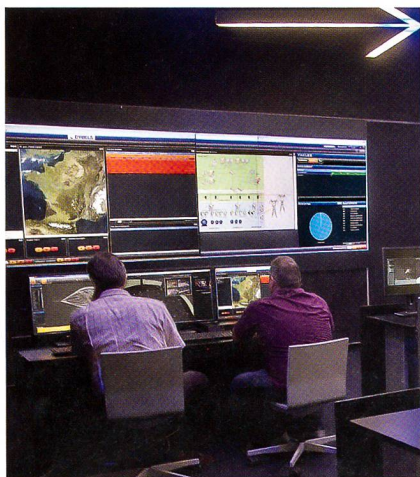
Thales im Kampf gegen Cyber-Angriffe.

Wie die in der Schweiz gut verwurzelte Firma Thales mit Communiqué vom 6. Februar 2014 mitteilt, eröffnete Thales unter dem Titel Critical Information Systems and Cybersecurity einen neuen Geschäftsbereich, der die Synergien zwischen den auf dem Gebiet der Internet-Sicherheit führenden Thales-Systemen und den Spezialisten im Bereich der Critical Information herstellt.