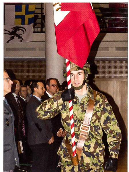
Die Fahne des St. Galler Geb Inf Bat 77.

Er kam dann auf die Lage in Europa bis zu den Jahren 2030 bis 2040 zu sprechen.