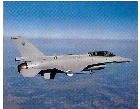
F-16C für die omanische Luftwaffe.

Der Jungfernflug der ersten F-16C für Omans Luftstreitkräfte fand Anfang Jahr bei Lockheed Martin statt. Bei dem Jet handelte es sich um eine Maschine aus dem Block 50. Oman hat am 14. Dezember 2011