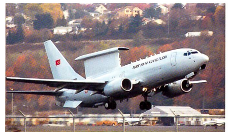
Frühwarnflugzeug Boeing 737 AEW&C der türkischen Luftwaffe.

Die Flugzeuge werden von den türkischen Luftstreitkräften als Frühwarn- und fliegende Kommandozentrale verwendet.