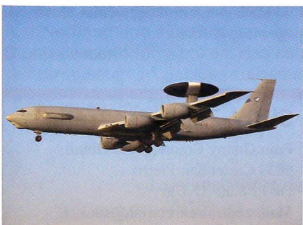
AWACS der französischen Luftwaffe.

Die französische Armée de l'Air konnte in Paris le Bourget ihr erstes modernisiertes E-3F-AWACS-Überwachungsflugzeug übernehmen. Damit die Frühwarnflugzeuge der französischen Luftwaffe kompatibel zu der USAF und den anderen NATO-Ländern bleiben, wird Frankreich ihre AWACS-Flugzeuge auf den neusten Stand bringen. Bei diesem Modernisierungsprogramm werden