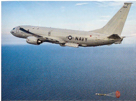
Torpedoabschuss einer P-8A-Poseidon.

Australiens Regierung hat sich für die Beschaffung modernster Boeing-P-8A-Poseidon-Seeaufklärer und -U-Bootjäger ausgesprochen. Boeing kann auf einen weiteren grossen Auftrag in seiner Militärsparte zählen – Australien wird für rund 3,6 Milliarden