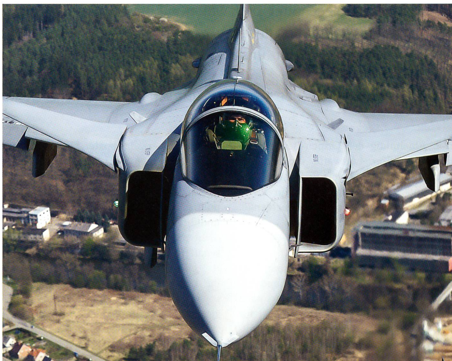
Am 18. Mai 2014 geht es um die Sicherheit der Schweiz. Stimmen wir Ja zum Gripen!

ner Ablehnung schnurstracks eine andere, teurere Maschine beschafft! Anzunehmen, dass ein Nein sofort die Evaluation der Typen X und Y auslösen würde, das heisst doch, an den Storch, den Osterhasen und das Christkind miteinander zu glauben.