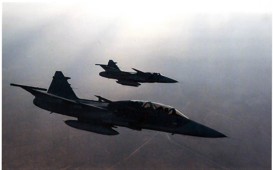
Der Gripen erfüllt für die Schweizer Luftwaffe alle militärischen Anforderungen.

Sogenannte Hot Missions , sehr schwierige Einsätze bei schwerwiegenden Verletzungen der Luftverkehrsregeln, kommen 10