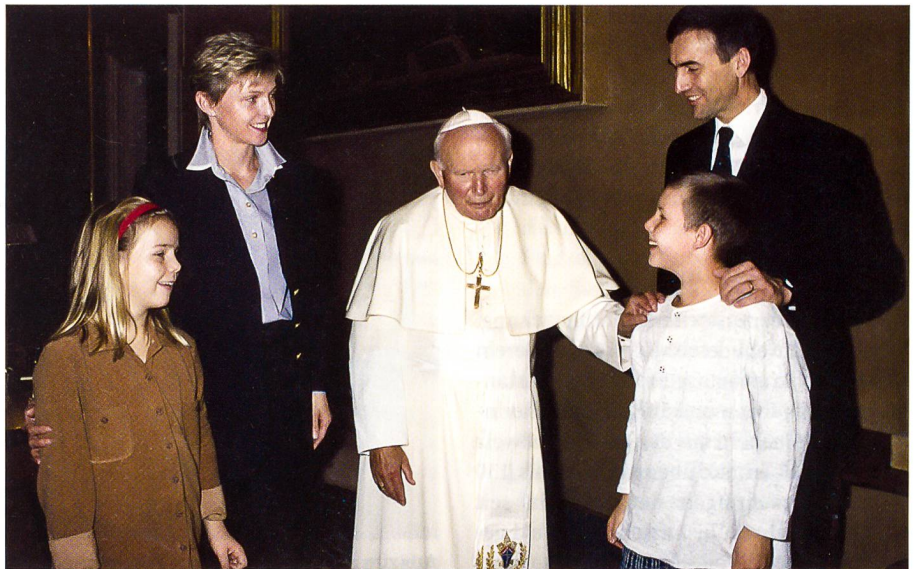
Johannes Paul II. nahm sich – trotz aller Termine – Zeit für die Familie Segmüller.

tat auf den Papst hätte für die Islamisten sicherlich grössere Symbolkraft als die Anschläge vom 11. September 2001 gehabt.