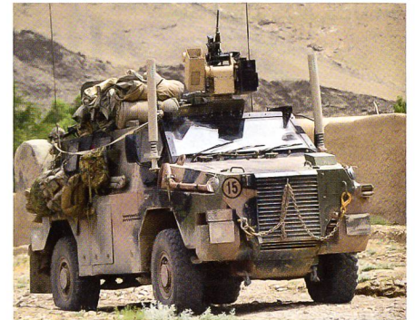
Geschütztes Fahrzeug Bushmaster für die jamaikanische Armee.

Thales Australia liefert zwölf geschützte Truppentransporter Bushmaster an die Streitkräfte in Jamaika. Die Fahrzeuge werden mit dem Kommunikationssystem Thales SOTAS M2 ausgestattet. Die Ausliefe-