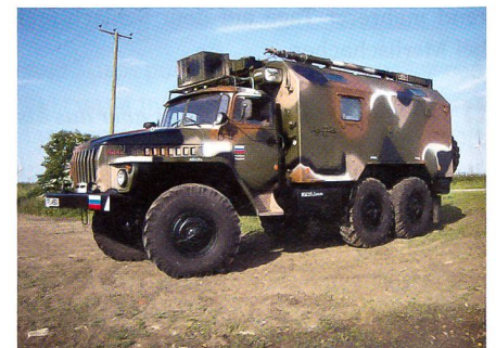
Geländelastwagen Ural-4320 als Basis für das geschützte Fahrzeug Federal-M.

Als Varianten sind im Wesentlichen Fahrzeuge mit kurzer und langer Fahrerkabine für Personentransport, Cargo und Sanitätsaufgaben vorgesehen. Mit etwa 16