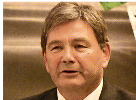
Der Nidwaldner Regierungsrat Schmid.