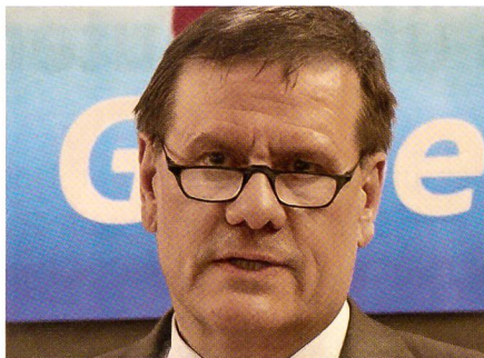
Der Thurgauer Ständerat Roland Eberle.