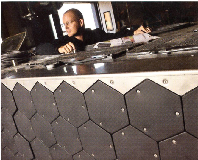
Neu am CV-90 von BAE: Mit speziellen Platten auf dem Panzer wird das Fahrzeug schwer sichtbar sogar für Nachtsichtgeräte.