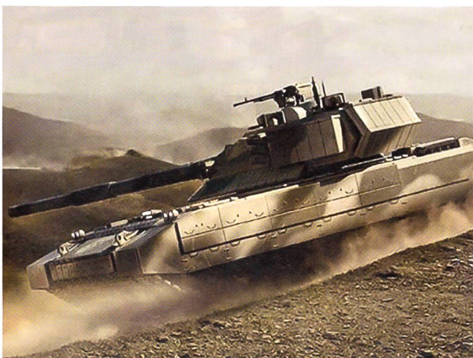
Die russische Firma Uralwagonsawod plant eine neue Panzer-Generation. Das gilt für die Schützenpanzer wie auch für die schweren Kampfpanzer in der Nachfolge des T-90.