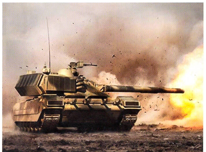
Bekannt ist, dass auch Russland eine einheitliche Plattform für alle Panzertypen entwickelt. Es wird angenommen, dass die Russen die Feuerkraft ihrer Panzer erheblich erhöhen.