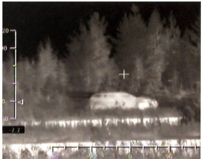
Nachts wird die Silhouette eines Autos oder eines anderen x-beliebigen Fahrzeugs oder Gegenstandes vorgetäuscht.