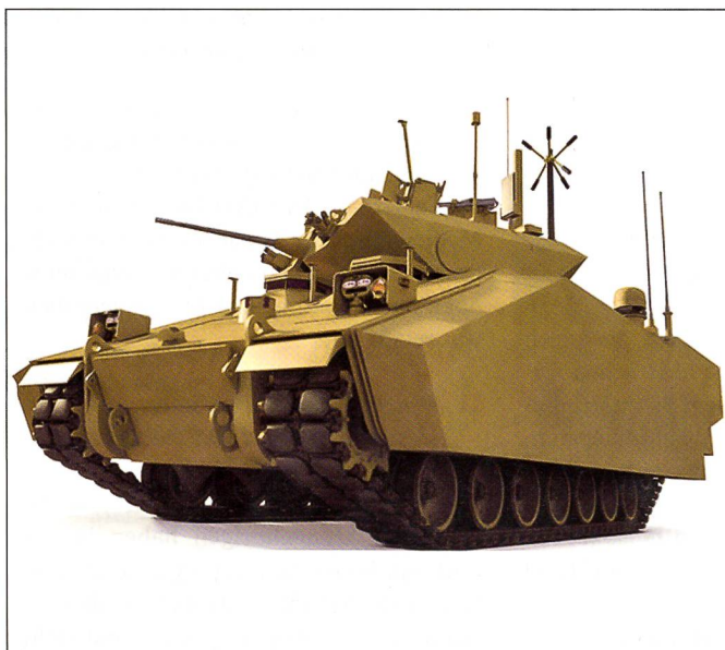
Das Heer der amerikanischen Streitkräfte, die US Army, strebt einen neuen Schützenpanzer für die Infanterie an: mit genug Platz für neun Soldaten und die dreiköpfige Besatzung.