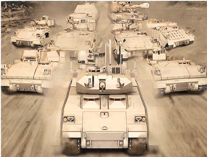
Man will eine Plattform für Sanitäts-, Transport- und Spähpanzer entwickeln – ein Basis-Panzer für alles quasi.