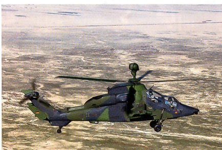
Kampfhelikopter Tiger in ASGARD-Konfiguration.

Anfang März wurde der letzte von zwölf Unterstützungshelikoptern Tiger (UH Tiger), welcher für den Einsatz in Afghanistan umgerüstet wurde, der Truppe übergeben. Der UH Tiger wird in Afghanistan für die Unterstützung von Bodentruppen, den Schutz von Konvois und Aufklärungsmis-