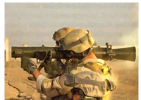
Mehrzweckwaffe Carl Gustav zur Standardausrüstung der US Army erklärt.

Die in mehr als 40 Ländern weltweit verbreitete Waffe wird in den USA unter der Bezeichnung M3 Multi-role Anti-armor